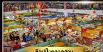
ช้อปปิ้งตลาดซาน