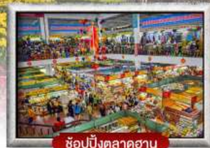
ช้อปปิ้งตลาดฮาน