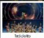
โชว์วงสวิง