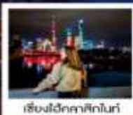
เชียงใหม่ได้คาศึกไนท์