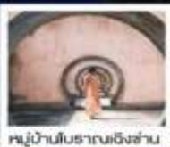
หมู่บ้านโบราณเชิงชัน