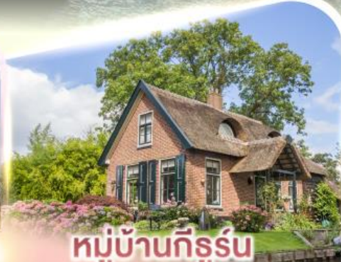
หมู่บ้านกิธูร์น