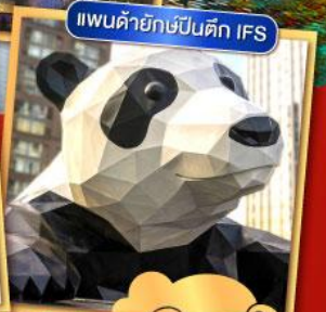
แพนด้ายักษ์ปิ่นตึก IFS