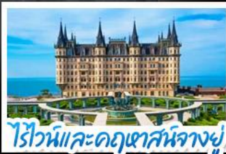
ไร่ไวน์และคฤหาสน์นางยู