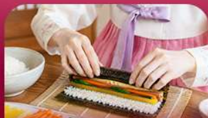
เรียงทำคิมบับ

สัมผัสเสน่ห์ฤดูหนาวของเกาหลีแบบอบอุ่นหัวใจพิเศษ! พักสกีรีสอร์ท 1 คืน ท่ามกลางบรรยากาศหิมะขาวโพลน สนุกกับกิจกรรมฤดูหนาวยอดนิยม ทั้งสกี สโนว์บอร์ดและสโนว์สเลด ก่อนออกเดินทางสู่เกาะนามิ ดินแดนแห่งความโรแมนติก ชมสตรอว์เบอร์รี่หวานฉ่ำ สด ๆ จากฟาร์ม พร้อมเรียนทำคิมบับเมนูยอดฮิตสไตล์เกาหลี ปิดท้ายด้วยการช้อปปิ้งสุดฟินที่เมืองคยองและซองซู ย่านอิคทีสายคาเฟ่และสายแฟชั่นห้ามพลาด