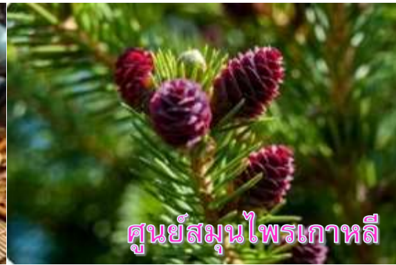
ศูนย์สมุนไพรเกาหลี

หลังจากนั้นนำท่านเดินทางสู่ย่าน เมียงดง (MYEONGDONG) ย่านช้อปปิ้งใจกลางกรุงโซลที่เต็มไปด้วยร้านค้า ห้างสรรพสินค้าชื่อดัง ร้านอาหารริมทางมากมาย โดยเมียงดงนั้นเป็นแขวงหนึ่งในเขตกรุงโซล มีพื้นที่เป็นที่ตั้งของร้านค้ากระจายตัวไปทั้งฝั่งตะวันออกและตะวันตก มีห้างสรรพสินค้าขนาดใหญ่ มีร้านขายสินค้าแบรนด์เนมมากมาย และยังมีสถานที่ท่องเที่ยวอันเป็นแลนด์มาร์กยอดนิยมนับมากมายด้วย อิสระให้ท่านได้เดินเล่นเลือกซื้อสินค้าตามอัธยาศัย