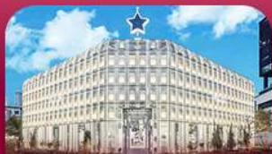
ชานซองซู