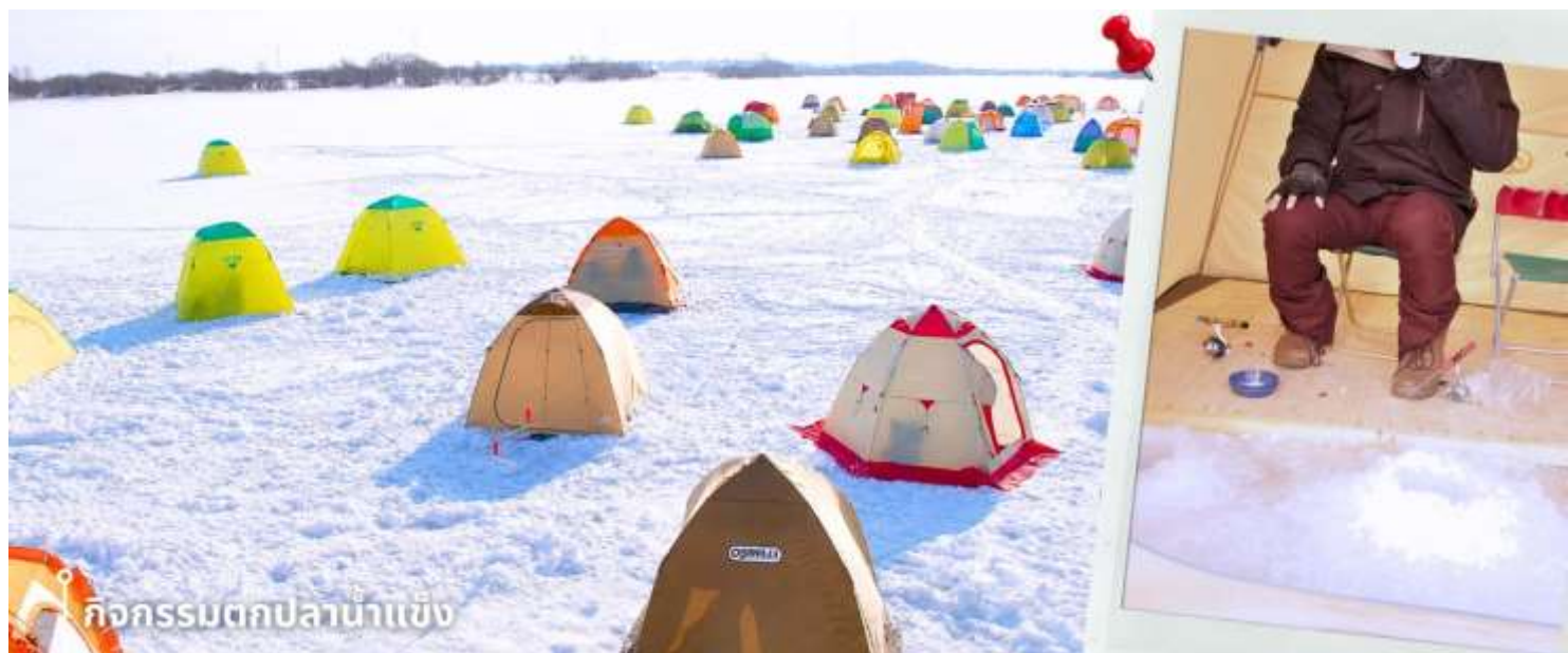
กิจกรรมตกปลาน้ำแข็ง

หลังรับประทานอาหารเที่ยง พาท่านทำกิจกรรมสุดฮิต กับ กิจกรรมตกปลาน้ำแข็ง (รวมค่าอุปกรณ์ตกปลา) กิจกรรมฤดูหนาวยอดนิยมของญี่ปุ่น กับการตกปลาน้ำแข็งท่ามกลางบรรยากาศธรรมชาติที่ปกคลุมด้วยหิมะสีขาว โดยในช่วงฤดูหนาว ผิวน้ำของทะเลสาบจะกลายเป็นแผ่นน้ำแข็งขนาดใหญ่ เปิดโอกาสให้นักท่องเที่ยวได้สัมผัสประสบการณ์ตกปลาในอากาศหนาวแบบดั้งเดิมของญี่ปุ่น ท่ามกลางบรรยากาศหิมะสีขาวและอากาศหนาวเย็นแบบญี่ปุ่นแท้ ๆ ท่านจะได้ลองตกปลาด้วยตัวเองบนผืนน้ำแข็งขนาดใหญ่ พร้อมดื่มด่ำกับวิวธรรมชาติอันเงียบสงบ