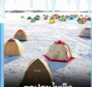
ตกปลาน้ำแข็ง