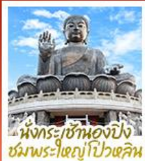
นั่งกระเช้ามองปิง ชมพระใหญ่ปัวหลิม

นั่งกระเช้ามองปิงสักการะพระใหญ่ปัวหลิม • วัดหวังต้าเซียน ขอพรสุขภาพ ความรัก วัดเขกทิว ขอพรองค์เซกง โชคลาภ การเงินและธุรกิจ • เจ้าแม่กวนอิมรพีลาสีย์ รับพลังงานดี เสริมพลังฮวงจุ้ย • วัดมื่นไทมว ขอพรเรื่องการศึกษ การงาน สติปัญญาและความกล้าหาญ