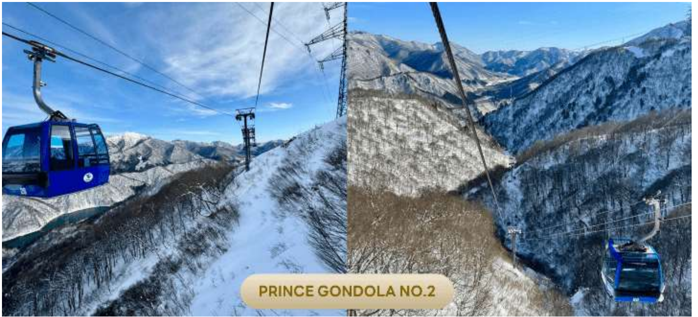
PRINCE GONDOLA NO.2