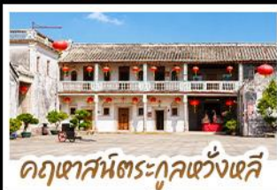
อุทยานวัฒนธรรมกุหลาบแดง

ตามรอยภาพยนตร์สุดซึ้งแห่งปี "จดหมายรักถึงอาม่า" • เยี่ยมเมืองโบราณแห่งจิ่ว ดินแดนต้นกำเนิดชาวจีนโพ้นทะเลที่อพยพสู่ประเทศไทย • เดินเล่นหมู่บ้านโบราณหลงหู สัมผัสบรรยากาศดั้งเดิมราวกับหลุดเข้าไปในอีกหนึ่ง • ชมย่านเมืองเก่าชิวเถาและ สวนสาธารณะเสี่ยววงหยวน หนึ่งในสถานที่ถ่ายทำที่ได้รับความนิยมจากแฟนภาพยนตร์ ชมจดหมายโบราณอายุกว่าร้อยปี ณ พิพิธภัณฑ์จดหมายชาวจีนโพ้นทะเล