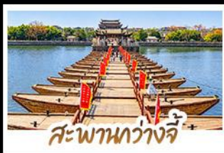
สะพานกว้างจี