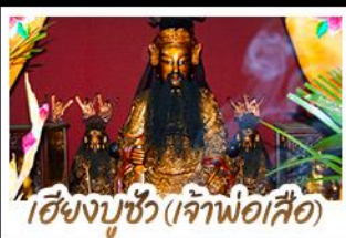
เซียงบูชิว (เจ้าพ่อเสือ)