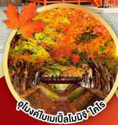
อุโมงค์ใบเมเปิ้ลโมจิ ไทโร