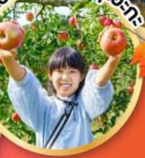
เก็บผลไม้เมืองชิซุโอะกะ