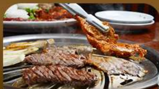
เมนูย่างสไตล์เกาหลี