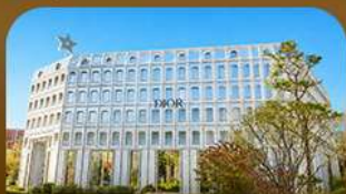
ย่านซองซู