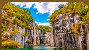
เขาดงเคียวเมืองโพซอน

คามหาไม้เปลี่ยนสีสุดโรแมนติก ชมวิวบึงเปิดหลากสีจากสะพานงูรูปตัว Y แห่งเมืองโพซอน สัมผัสความงดงามของโพซอนอาร์กิวเรลย์ • เดินเล่นท่ามกลางต้นแปะก๊วยและเมเปิ้ลในพระราชวังเคียงบกกุง ชมหมู่บ้านอันอบอุ่นกลางบรรยากาศชิวๆ และปิดท้ายด้วยทุ่งหญ้าสีทอง ณ สวนฮานึล แลนด์มาร์กยอดนิยมของกรุงโซล ในช่วงฤดูใบไม้เปลี่ยนสีที่สวยงามที่สุด