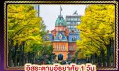
ฮิโระตามอริยาตัย 1 วัน

🧳น้ำหนักกระเป๋า 20 Kg. บริการอาหาร บนเครื่อง ไป-กลับ