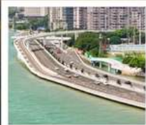
สะพานเหยียนหวู่เฉียว