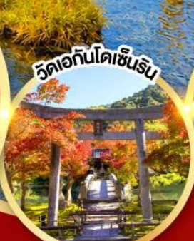
วัดเอกันโตเซ็นริน