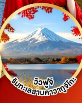
วิวฟูจิ ริมทะเลสาบคาวากูจิโกะ