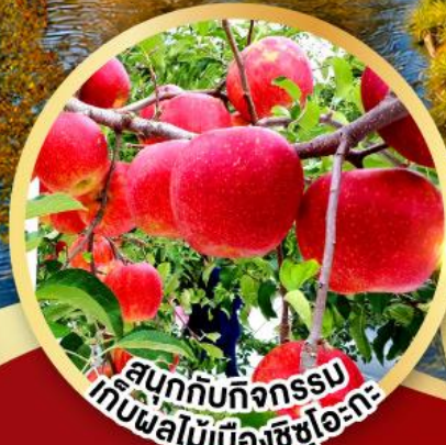
สนุกกับกิจกรรม เก็บผลไม้เมืองชิซุโอะกะ