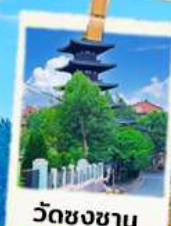
วัดชงชาน