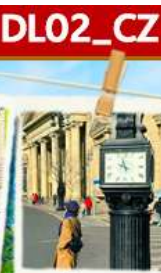
จัตุรัสจงชาน