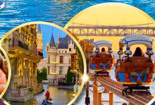
เมืองน้ำเวนิส