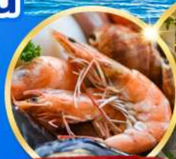
อาหารซีฟู้ด