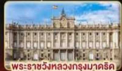
พระราชวังหลวงกรุงมาดริด