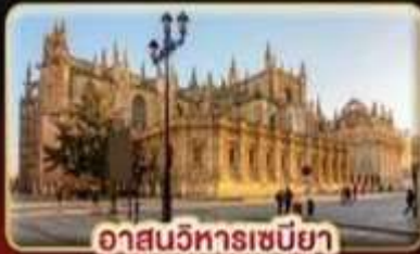
อาสนวิหารเซบิยา