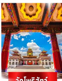
วัดโพธิ์สัตว์