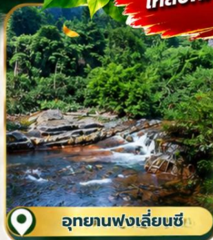
อุทยานฟ่งเลี่ยนซี