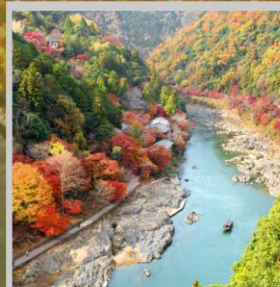
“ARASHIYAMA MT. KAMEYAMA”