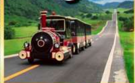
อุทยานนางฟ้า