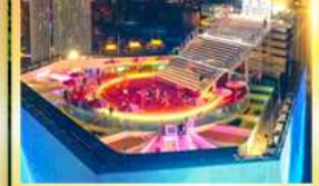
จุดชมวิวจงซึ่งเวลาดึตรด 131