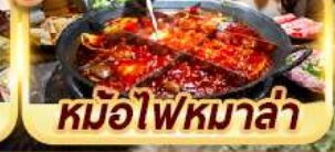
หม้อไฟหม่าล่า