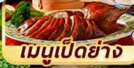
เมนูเป็ดย่าง