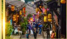
หมู่บ้านโบราณฉือซื่อไซ่ว