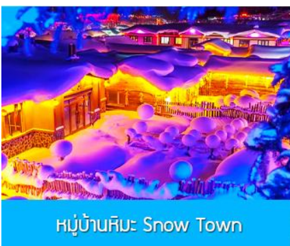
หมู่บ้านหิมะ Snow Town

ท่ามกลางท้องทุ่งและผืนป่าที่ปกคลุมด้วยหิมะราวกับอยู่ในโลกแห่งเทพนิยาย ผ่านหมู่บ้าน เว่ยหูจ้าย 威虎寨 ที่อดีตเคยเป็นที่ตั้งของรังโจรที่มักออกปล้นสะดมชาวบ้าน ม้าลากเลื่อนเป็นยานพาหนะเฉพาะพื้นที่ ๆ ที่นิยมนำมาใช้ในการเดินทางหรือลำเลียงสิ่งของในช่วงฤดูหนาว ที่ใช้ม้ามาลากจูงแคร่เลื่อนให้สามารถเคลื่อนย้ายบนลานหิมะได้