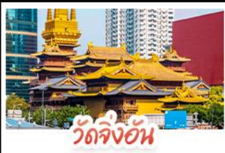
วัดจิ้งอัน

ล่องเรือสุดโรแมนติกแม่น้ำหวงผู่ จตุรัสเทียนอันเหมิน จตุรัสใหญ่ที่สุดในโลก ใจกลางประวัติศาสตร์จีน พระราชวังต้องห้าม พระราชวังโบราณสุดอลังการ มรดกโลกยูเนสโก ถนนนานกิง แหล่งช้อปปิ้งสุดฮิต แบนด์เนม ของฝากเพียบ