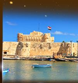
บึงปรามาร Quite Bay