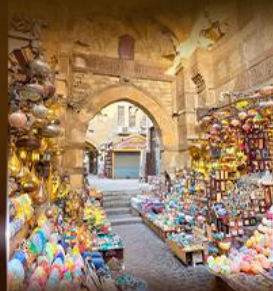
ตลาดฟานเวลกาลี