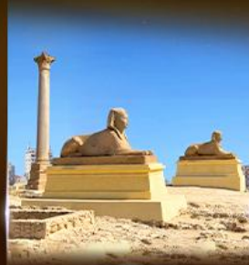
เฮลิโพลิส