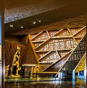
พิพิธภัณฑ์แกรนด์อียิปต์ (GEM)