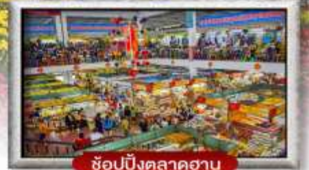
ซ้อปบิ่งตลาดฮาน