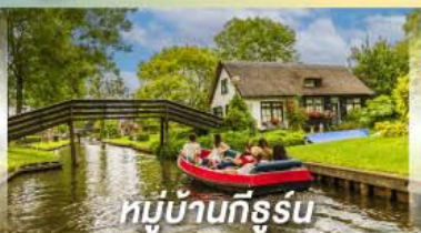
หมู่บ้านทีรูร์น