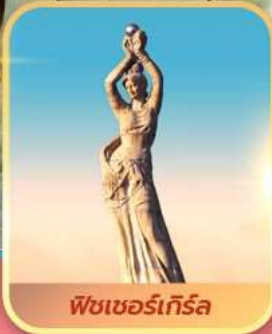
พีชเซอร์เก็รล