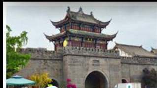
เมืองโบราณกวนเซี่ยน

ภูเขาสดุดณี - อุทยานป่ฝิงโกว - สะพานหนานเฉียว - ร้านหนังสือจงซูเก้อ - เมืองโบราณกวนเสียน จตุรัสหยางเทียนหวู่ - หมู่แพนต้าเซอเฟี - ถนนโบราณชอยกวงชอยแพบ - ถนนคนเดินไท่กู่หลี่ ถนนคนเดินซุนซี - ถนนโบราณจิ้นหลี่ - แพนต้าหยกซิปิงตัก - น้ำพุไม้ไผ่ตักSKP - วัดต้าเฉียว