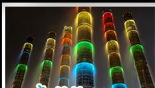
น้ำพุไม้ไผ่ตักSKP