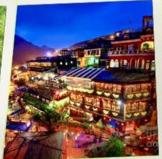
หมู่บ้านโบราณจิว่เฟิน