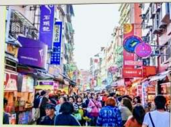
ถนนโบราณตี๋นส่วย