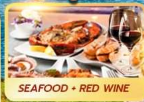
SEAFOOD + RED WINE