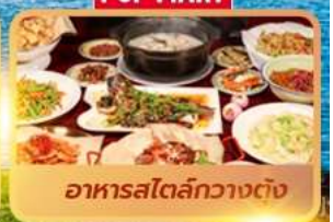
อาหารสไตล์กวางตุ้ง