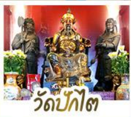
วัดป้กโก๊ต