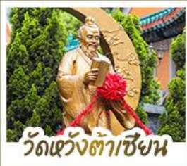
วัดเว้า่งเต้าเซ้า่น