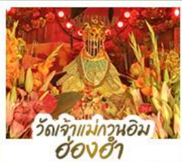
วัดเจ้าแม่กวนอิมอ้อ่งฮ้า