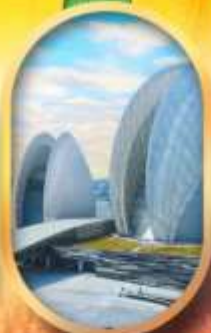
โรงละครไข่มุก