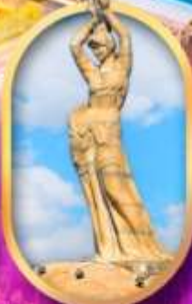
เด็กหญิงชาวประมง