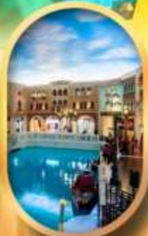
เดอะเวนิเซียน