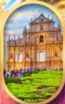
โบสถ์เซนต์พอล