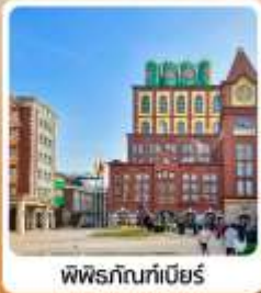
พิพิธภัณฑสถาน