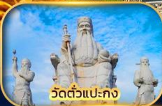
วัดตัวแปะกง