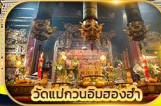
วัดแม่กวนอิมฮ่องฮ่า