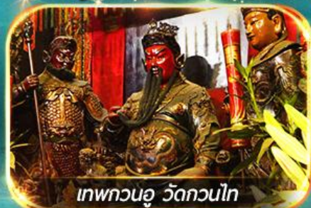
เทพกวนอู วัดกวนไท

พามุไหว้พระ-ขอพร 8 วัดดัง, อิสระช้อปปิ้ง 1 วันเต็มแบบจุใจ หรือเลือกซื้อ OPTION กระเป๋าหนัง 360 / ดิสนีย์แลนด์