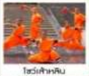
โชว์เจ้าหลิน