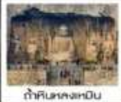
ท่าหินหลงเหมิน