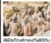
เมืองโบราณคังคังเค่ไต้ฉัน