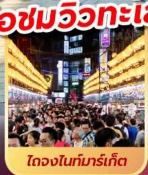
ไถจงไนท์มาร์เก็ต