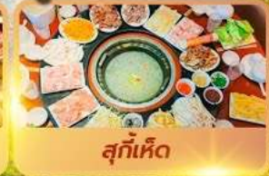
สุกี้เด็ด