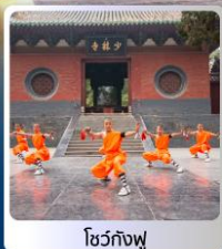
โชว์กังฟู