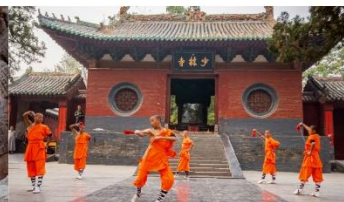
ชมโชว์กังฟูเส้าหลิน

*ทางบริษัทฯ ขอสงวนสิทธิ์ในการสลับโปรแกรมทัวร์ตามความเหมาะสมขึ้นอยู่กับสถานการณ์หน้างาน โดยคำนึงถึงผลประโยชน์ของลูกค้าเป็นสำคัญ