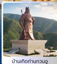
บ้านเกิดท่านกวนอู