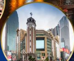
ถนนคนเดินเจียฟางเป่ย์