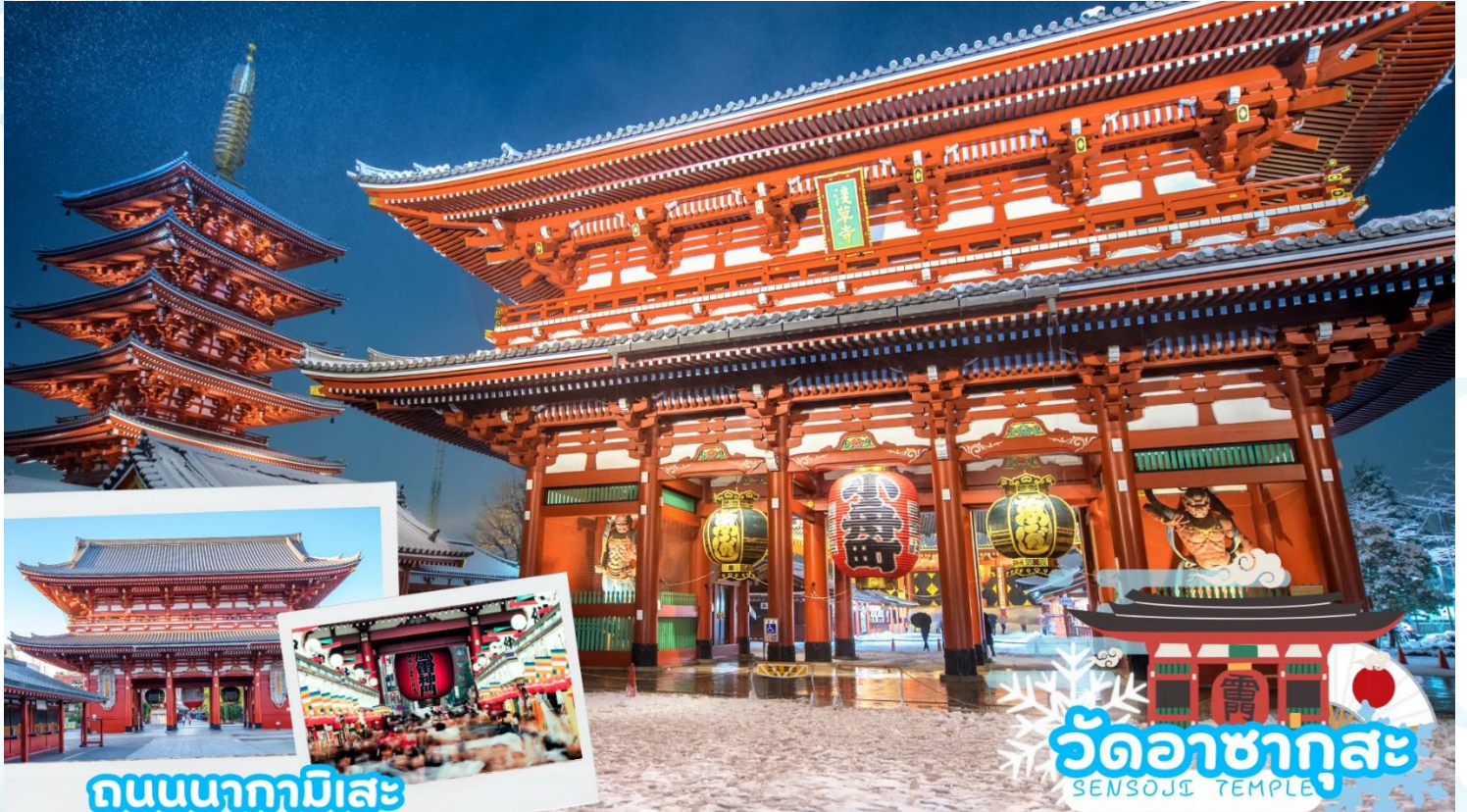
ถนนนากามิसे

นำท่านเดินทางสู่ วัดอาซากุสะ (Asakusa) วัดที่เก่าแก่ที่สุดในกรุงโตเกียว ขอพรจากพระพุทธรูปเจ้าแม่กวนอิมทองคำ ท่านยังจะได้เก็บภาพประทับใจกับโคมไฟขนาดยักษ์ที่มีความสูงถึง 4.5 เมตร ซึ่งแขวนอยู่บริเวณประตูทางเข้าวัด และยังสามารถเลือกซื้อเครื่องรางของขลังได้ภายในวัด ฯลฯ หรือเพลิดเพลินกับ ถนนนากามิसे ถนนช้อปปิ้งที่มีชื่อเสียงของวัด มีร้านขายของที่ระลึกมากมายไม่ว่าจะเป็นเครื่องรางของขลัง ของเล่นโบราณและตบท้ายด้วยร้านขายขนมที่คนญี่ปุ่นชื่นชอบ แม้กระทั่งองค์จักรพรรดิองค์ปัจจุบันยังเคยเสด็จที่วัดแห่งนี้