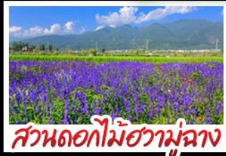
สวนดอกไม้ฮาวามู่ฉาง