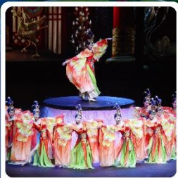
โชว์ FOSHAN QIANGQING