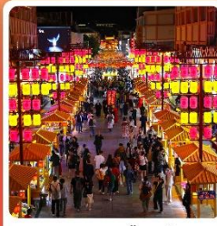
ตลาดกลางคีนซาโจว