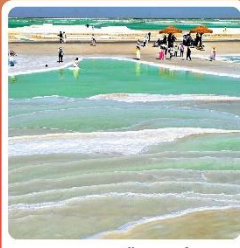
ทะเลสาบเกลือจาเอ้อหนาน