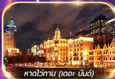
หาดไว่กาน (เดอะ บันด์)

เที่ยวดิสนีย์แลนด์เต็มวัน (รวมรถรับ-ส่ง)