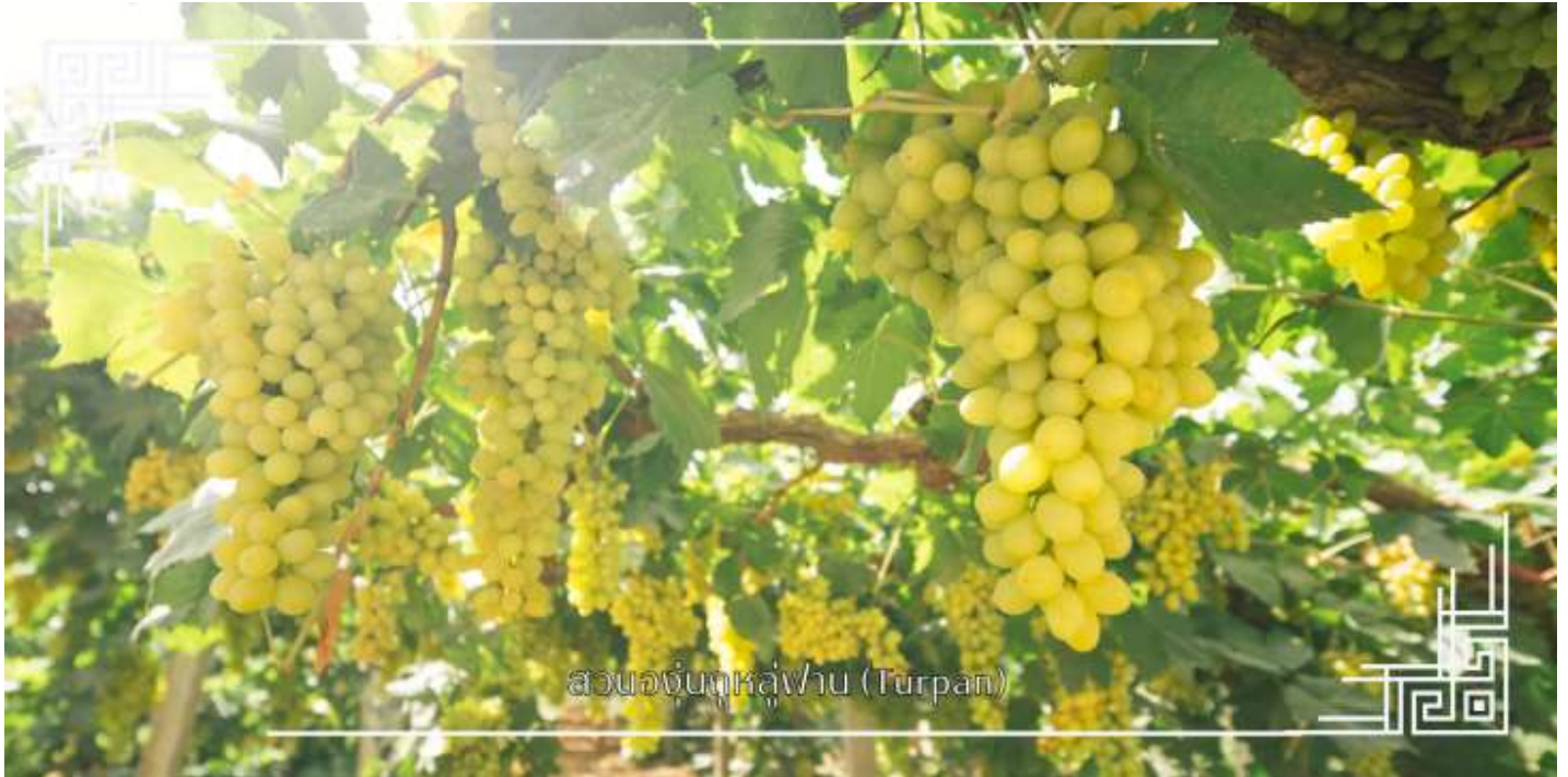
สวนองุ่นทะเลสาบ (Turpan)

นำท่านแวะชม สวนองุ่น (มีเฉพาะเดือนมิถุนายน-สิงหาคม) แหล่งผลิตองุ่นไร้เมล็ดที่หวานและใหญ่ที่สุดของจีน ในหุบเขาที่ ร่มรื่นไปด้วยเถาองุ่นสีเขียวขจี ท่ามกลางบรรยากาศร่มรื่นกลางทะเลทราย