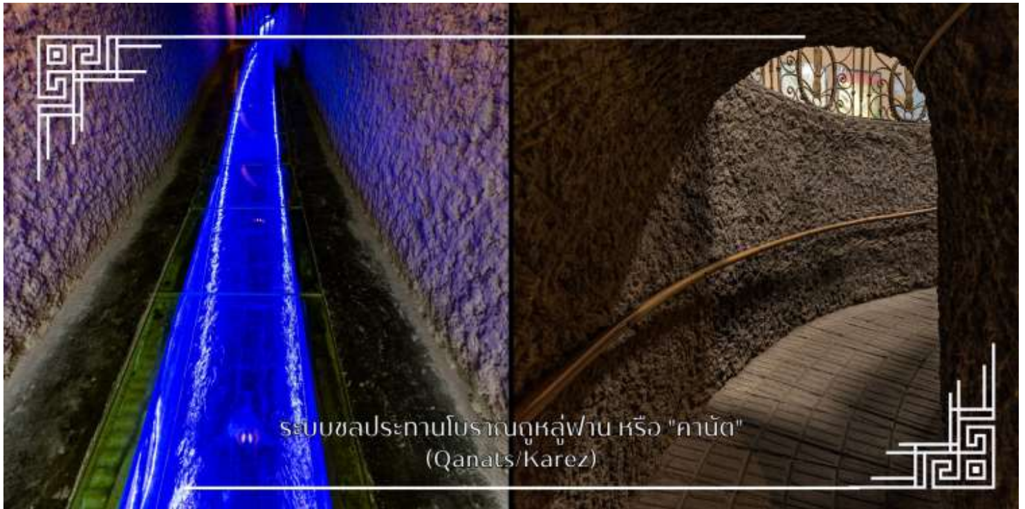
ระบบชลประทานโบราณถูลูฟาน หรือ "คานัต" (Qanats/Karez)

ระบบชลประทานโบราณถูลูฟาน หรือ “คานัต” เป็นระบบส่งน้ำใต้ดิน ในเขตซินเจียง ประเทศจีน ใช้ภูมิปัญญาชุดอุโมงค์ ใต้ดินเชื่อมต่อกัน เพื่อนำน้ำจากหิมะละลายบนภูเขามาใช้ในโอเอซิสทะเลทราย ลดการระเหยของน้ำ ทำให้เมืองถูลูฟาน อุดมสมบูรณ์และเป็นแหล่งปลูกองุ่นขึ้นชื่อ