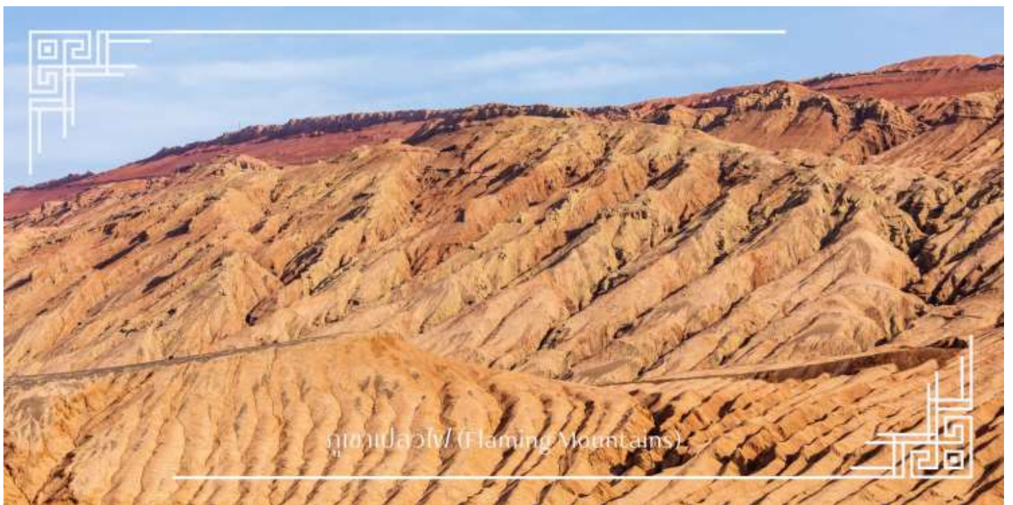
ภูเขานเปลวไฟ (Flaming Mountains)