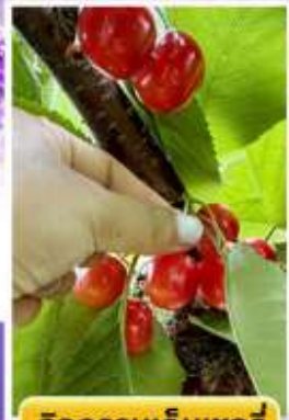
กิจกรรมเก็บเชอร์รี่

🍽️ ออนเซ็น 2 คืน 🧳 นน.กระเป๋า 23 กก. 1ใบ ☀️ 6Days 4Night