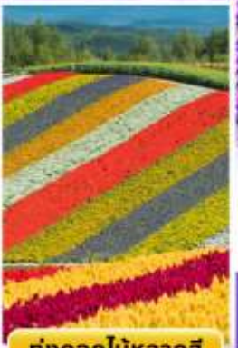
ทุ่งดอกไม้หลากสี