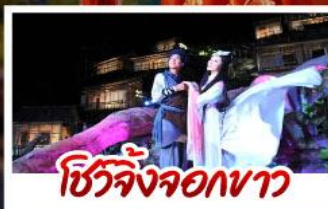
ชีวิตจริงจอกงชา