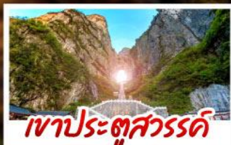
เขาประตูลี้สวรรค์