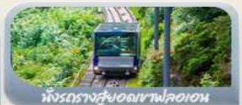
นั่งรถรางสู่อุดเขาฟลอม